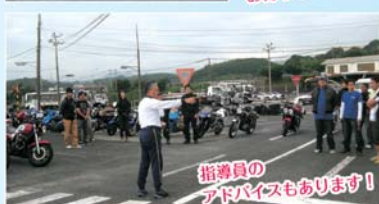
爽やかな風を受けながら みんなでテクニックを磨きます！