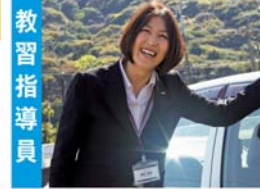
教習指導員 見た目は怖いけどやさしいよ(笑)

フロントスタッフから晴れて教習指導員になりました♪ 新米指導員ですが、熱意だけはだれにも負けません!! 免許を取得するあなたの気持ちに必ず答えます!