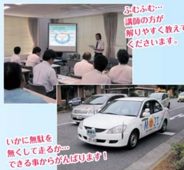
いかに無駄を 無くして走るか… できる事からがんばります！

アイル門司では4月に一般企業の方々に対し、エコドライ ブ講習を行いました！ 地球にやさしいエコドライブの意義や運転方法の指導、 今までの運転方法とエコドライブ方法指導後で燃料の消 費量を計測・比較し、その結果をもとにディスカッション を行ってエコドライブを推進していただくという内容 です！