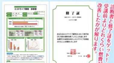
診断書と修了証をゲット！ 受講前よりどれくらい燃費が 改善したかが解ります。

Bさん 「アクセルの踏み方が難しかったです。数字ではっきりと違いが分かっ て無駄に燃料の消費をしていることがよく解るのですが、できること から少しずつ地球にもお財布にも優しい運転に心がけます(´・`;)!!」