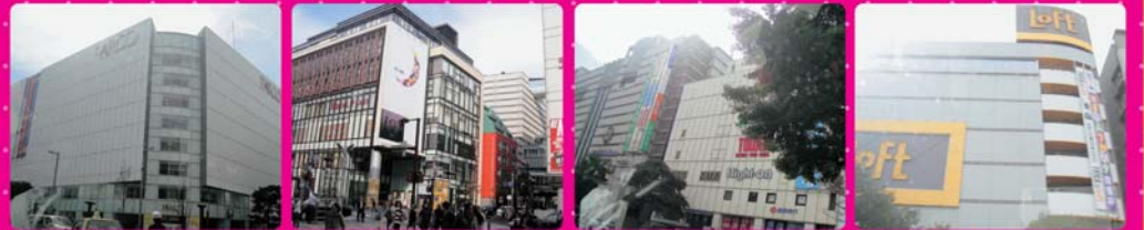
PARCO VIORO SOLARIA 天神LOFT