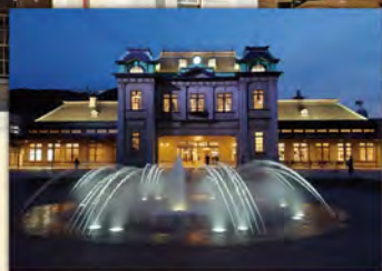
夜のライトアップは幻想的