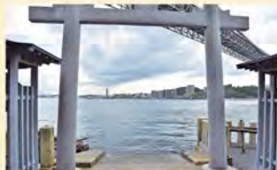
この鳥居の先は、すぐ海！