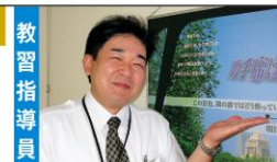
運転は一日にしてならず

座右の銘 助手席は卒業だ!! コメント 一緒に楽しく教習して、車の運転が楽しくなるようにしましょう。