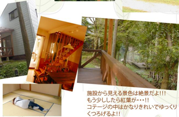
見て、この優越感に浸った感じ・・・

施設から見える景色は絶景だよ!!! もう少ししたら紅葉が・・・!! コテージの中はかなりきれいでゆっくりくつろげるよ!!