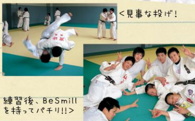
練習後、BeSmileを持ってバキリ!!>

春の高校選手権を制覇、金鷲旗も準決勝進出し、また全国高等学校総合体育大会へとすばらしい成績を残している彼女たち。練習中は真剣そのもの。でも終わったときのおちゃめなところがとってもカワイイ~!!今回3年生からコメントもらいました。