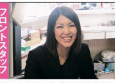
外見より中身で勝負!!

座右の銘 継続は力なり コメント 免許を取るならアイル関門へどうぞ♥ 皆様の入校を首を長くして待っています。